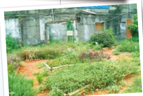
台北花博綠點展出都市可食地景香草花園