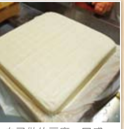
自己做的豆腐，口感一級棒。