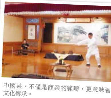
中國茶，不僅是商業的範疇，更意味著文化傳承。

區(指中國的東北、華北和西北地區)族群以飲用花茶為主，比例達一半以上。不少茶消費者長期認同一種茶類，其他品種的茶葉往往難以接受。