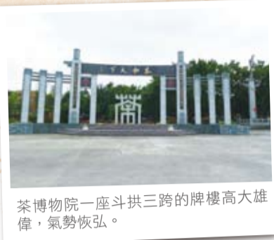
茶博物院一座斗拱三跨的牌樓高大雄偉，氣勢恢弘。

一般專家認為，中國茶從來都是「豎」著做，而天福是「橫」著做。中國茶葉生產的地域性特徵非常明顯，譬如武夷山產大紅袍、安溪產鐵觀音、浙江產龍井等等。茶葉的消費同樣也體現出很強的地域性，三北地