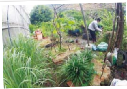
野蔓園溫室旁食物森林——利用地覆法(Mulch)保護土壤。