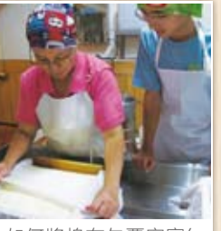
如何將棉布包裹密實(整形)