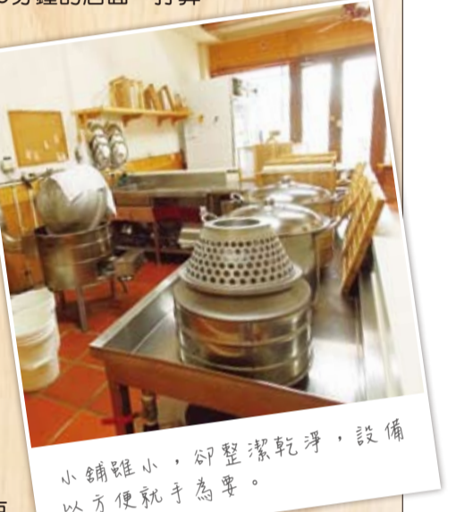
小舖雖小，卻整潔乾淨，設備以方便就手為準。

除了成品販售，店裡也提供每日限量的豆漿，免費提供來店的客人飲用。因為沒有多餘的人力可以招呼客人，店內採自助式，自行取用。外帶的冷藏櫃就放在入門的右手邊，客人拿取之後，自行將現金放入櫃檯上的分類錢櫃內、自己找零；附近的鄰居，也可自備保鮮盒或器皿，省去包裝盒的費用，又很環保。高品質的有機豆腐渣，可以免費取用回家，製成豆渣餅、醃日式醬菜；壓模之後蒐集下來的豆腐水，含有豐富的皂素，就是最天然的清潔劑。