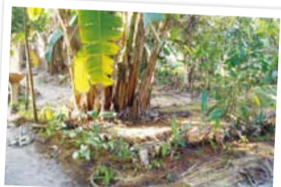
泰國Panya樸門農場的食物森林——香蕉圈，作物植栽採用豆科、灌木、喬木等，營造支持食物森林。

收益系統即食物森林設計中能直接提供收益(產出)的部份，包含了各種果樹、堅果、木材、香草藥用樹種等。收益系統設計必須同時考