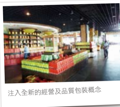
注入全新的經營及品質包裝概念