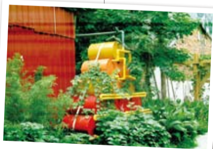
台北花博綠點水撲滿