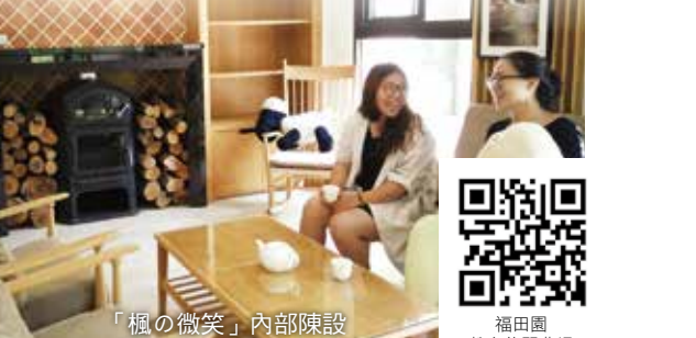
「楓の微笑」內部陳設