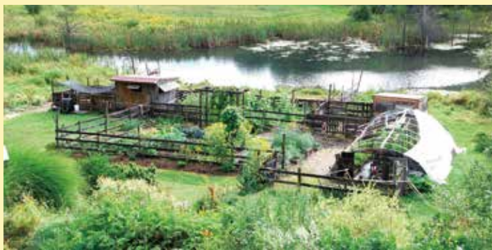
↑理想的農地環境，需要有長綠的灌木田籬，以及各類多年生、單年生的雜草，這些雜草田埂與田籬旁的雜草除了必要的修剪，不宜太過於干擾。

絕 大多數人都不知道「台灣錢，淹腳目」、「台灣好趁吃」等台灣俗諺，其實都是從清朝初期流傳下來。清知府高拱乾形容「台灣地氣和煖，無胼手胝足之勞，而禾易長畝。」黃叔璥所撰《赤嵌筆談》，則記載台灣「土壤肥沃，不糞種；糞則穗重而仆。」稻作種植及菜籽撒下後就放任其自生自長，就可以等收成，突顯寶島台灣「有種必穫」，擁有地理、氣候、生物多樣性等絕佳條件。