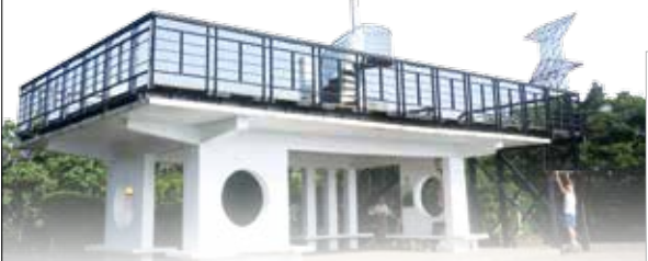
↑ 大崙頭山山頂平台的乘風堡