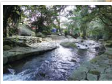
清澈的菁礬溪流貫園區