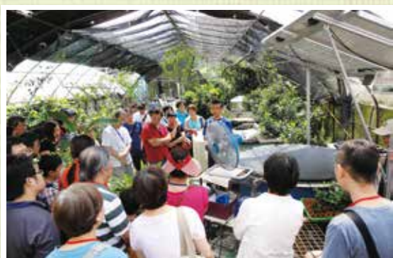
魚菜共生實驗農場吸引同好共學

「魚菜共生」又稱為養耕共生或複合式耕養，它是一種結合水產養殖與水耕栽培的一種生態系統。「魚菜共生」看似簡單的四個字，這裡面牽涉到許多專業的問題，例如需要哪些基本設備？水槽的大小？使用哪一種馬達抽水，才能有效的控制水流量？水質如何保持及測