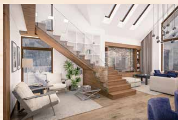
選用木料，有助提升居家自然舒適的調性。

聰明選擇好的木材，才能達到與森林環境同步呼吸的效果，反之，有害身體健康，勞民又傷財！「始於一粒種子，穿越樹木生長的軌跡，開啟木材的旅程。」當木材旅程進入了您的生活，恬靜自然的氛圍希望可以更適切地提供大家最佳的居家選擇，自在享受生活。