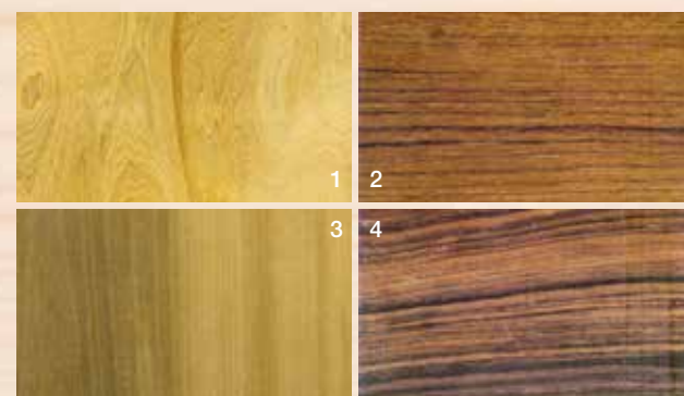
1.扁柏 2.柚木 3.烏心石 4.紫檀