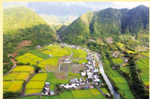
↑樂活有機之島的農村樣貌應包含多樣的農村環境，譬如：耕地和果園、稻田、灌溉用的池塘和溝渠、村落與農場本身，這些環境所組成複合式的農村生態系。

總結而論，台灣固有的人文精神和小農制度，符合了有機農業的藍圖，亟待轉換思維，重新找回這塊土地的原貌，有河、有山、野花紅似火、鵝兒戲綠波、昂首唱清歌，無憂無慮的美好農村風貌，有賴大家齊心揮灑。